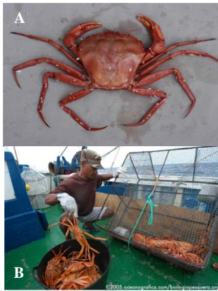
Fig. 2 – Recursos con interés pesquero: A. Ejemplar de cangrejo rey. B. Captura de cangrejo rey con nasas bentónicas durante la campaña de prospección, en Cabo Verde.